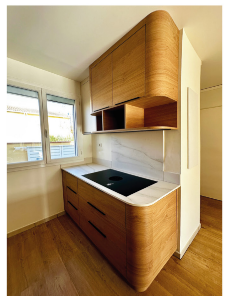
Architecture intérieure : création d'une cuisine style néo-art nouveau. Design & création et suivi de chantier Apparences Décoration.