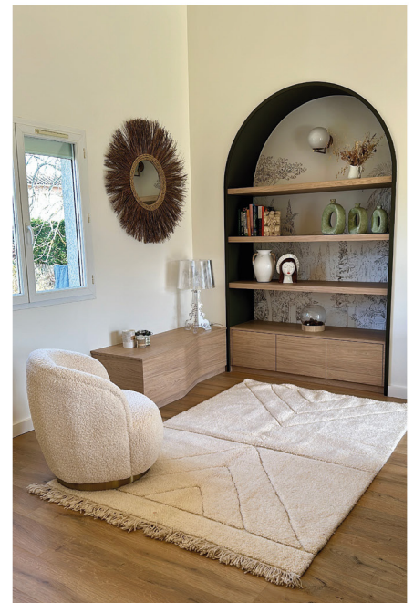
Architecture intérieure : transformation d'un salon, création d'arches qui rythment l'ensemble. Tapisserie, objets déco & tapis disponibles au concept-store Apparences Décoration.

Dans ses conceptions, elle attache une grande importance à allier la forme et la fonction. C'est la clé d'un projet réussi pour un bon designer.