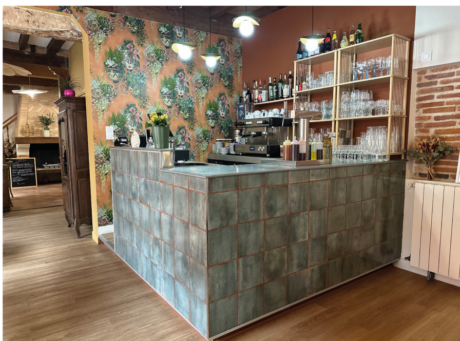
Architecture intérieure : création d'un restaurant - salon de thé. Tapisserie et matériaux disponibles au concept-store Apparences Décoration Design & création Apparences Décoration.